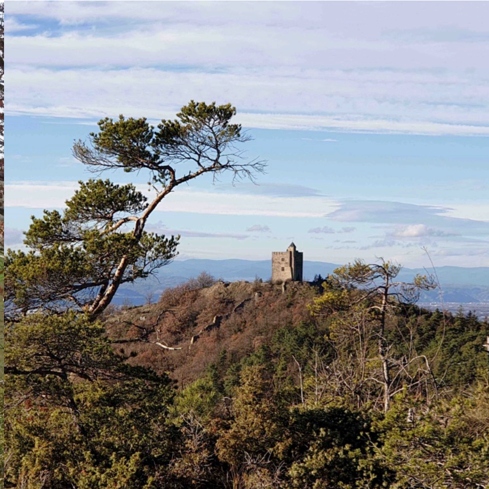
Donjon de Barcelonne