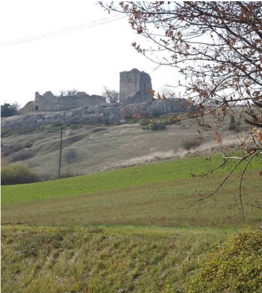
Donjon de La Baume Cornillane

Au pied du Vercors, érigés sur deux collines émoussées