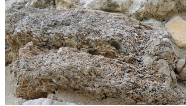
Grès graveleux lité